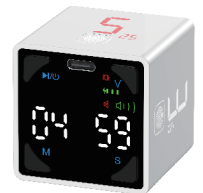
5-minutos comienza la cuenta regresiva

Tiempo disponible: 1 minuto, 3 minutos, 5 minutos, 10 minutos